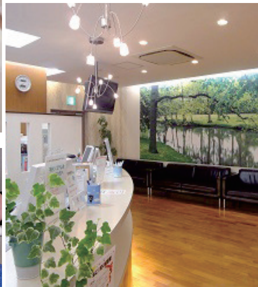
広々としたアロマ香る空間