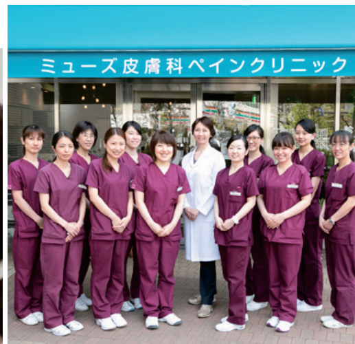
患者様一人一人の皮膚のお悩みを解決致します。悩まずにご相談下さい。